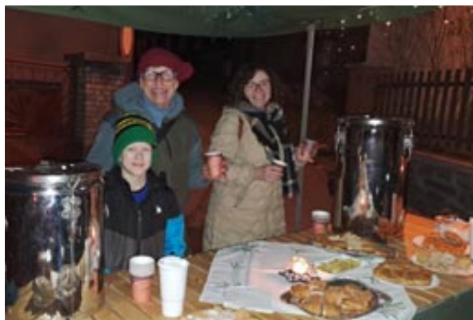
Členky kulturní komise – rozsvěcení vánočního stromku