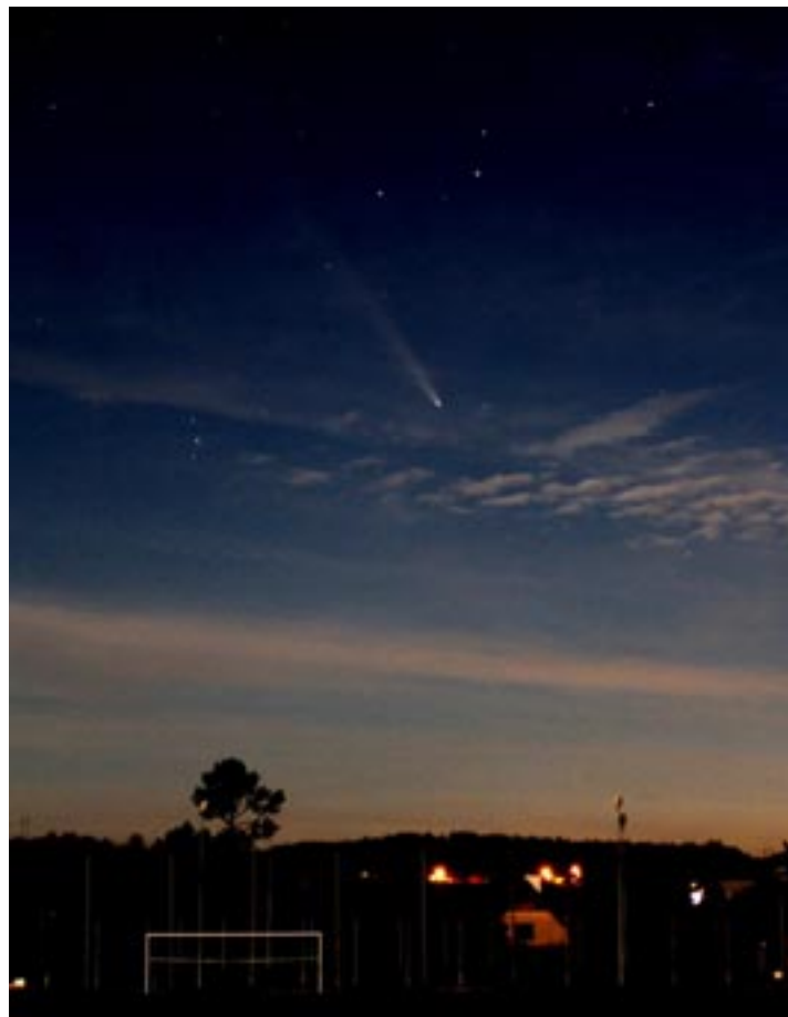
Přelet komety C/2023 A3 nad Kamenným Přívozem, 15.-16. 10. 2024